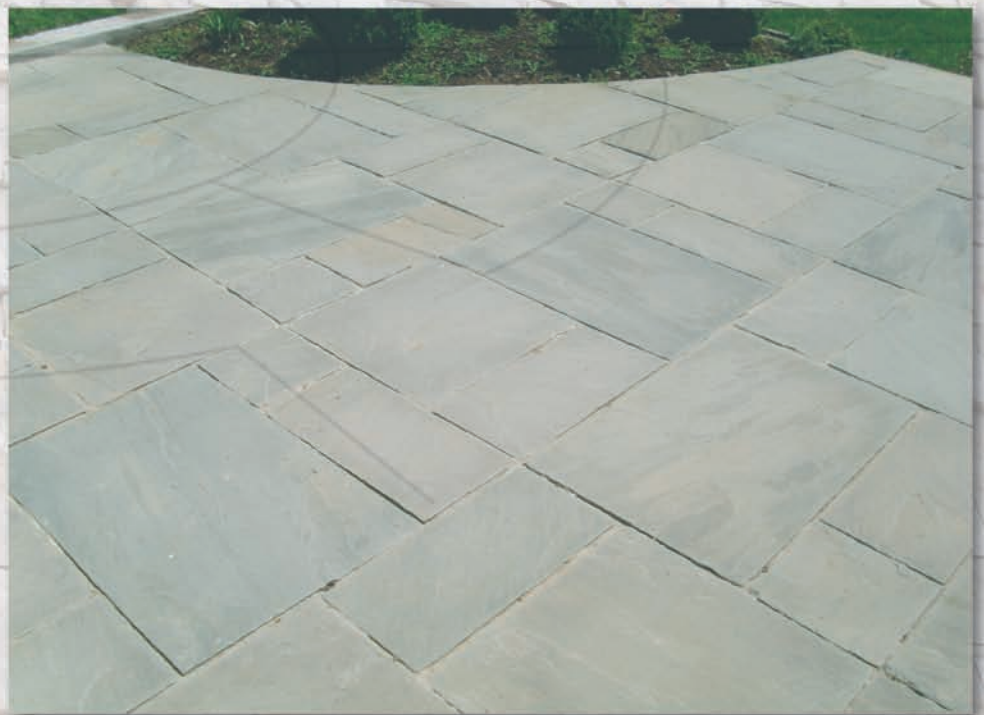
Opus Romain vieilli