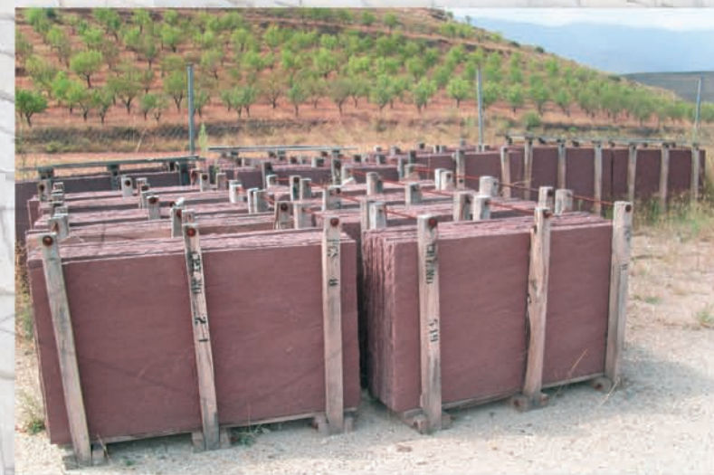
Stock de Lauses