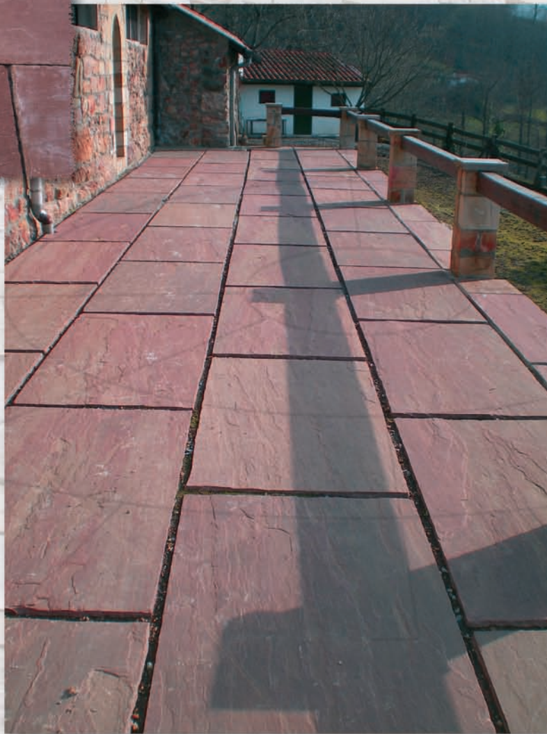
Dallage en pieces de 140 x 80 cm